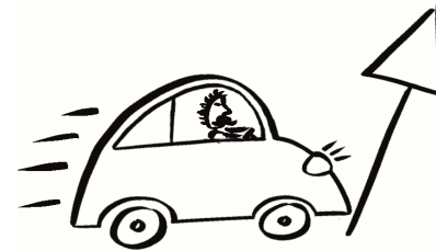
Er fährt das Schild um .